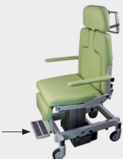
Ausklappbare Fußstütze Fold out foot support