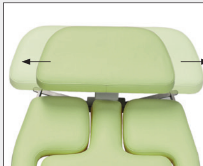
Verschiebbare Kopfstütze Shifting head rest