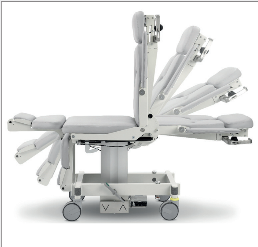
Stufenlose Verstellung Infinitely adjustable