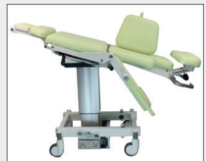
Trendelenburgposition lässt sich in Sekunden herstellen Trendelenburg position is available in just seconds