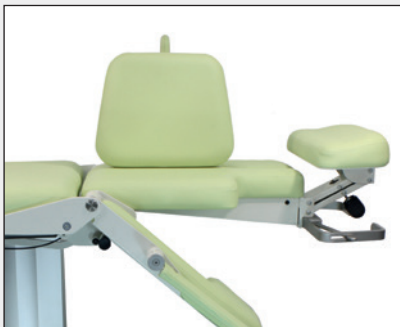
Rückenstabilisator Back stabilizer