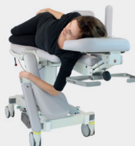
Biopsie Position Biopsy position