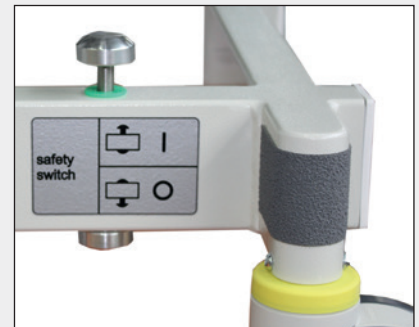
Sicherheitsschalter Safety switch