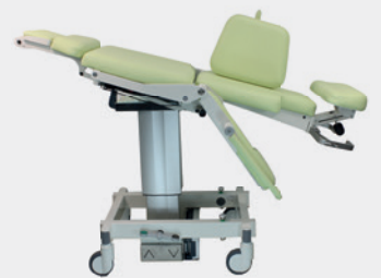
Schockposition Shock position