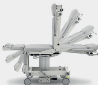
Stufenlose Verstellung Infinitely adjustable