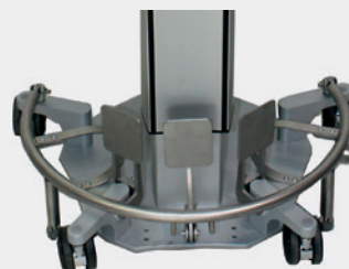
Fußbedienung Foot controls