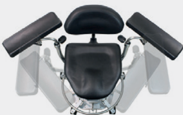
Bewegliche Armstützen Swiveling arm rests