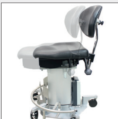
Sitzflächenverschiebung Seat cushion shift