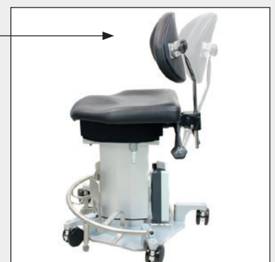
Rückenlehnenkipfung Back rest tilt