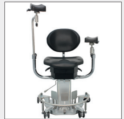
Kurzer oder langer Schaft Short or extended shaft