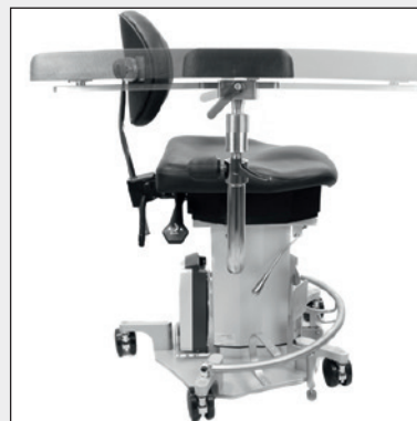
Mehrgelenksarmlehnen • kippbar (Kugelkopf) • vor - rückwärts verschiebbar