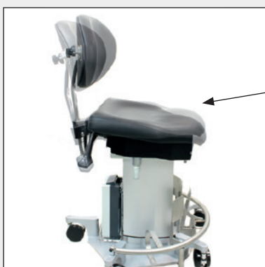
Sitzflächenkipfung Seat cushion tilt