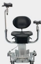
Kurze / lange Armstützen Short / extended arm rests