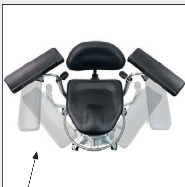
Armlehnen schwingen Arm rests swivel