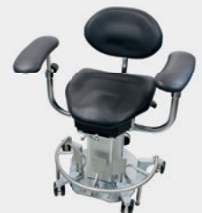
Anatomisches Sitzpolster Anatomical seat cushion