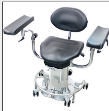
Mehrgelenksarmlehnen Multi articulated arm rests