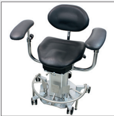
Standard Armlehnen Standard arm rests